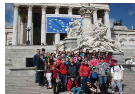
Školní exkurze a výlety