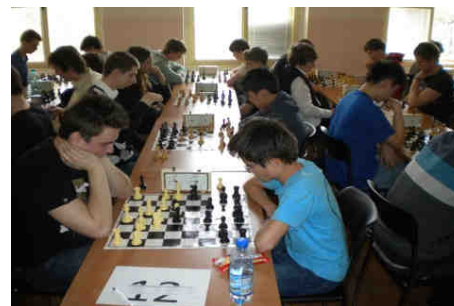
Šachový turnaj v Praze