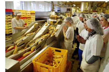
Firma Inpeko, Ústí n.L.