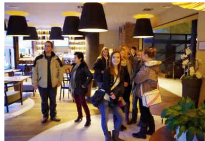
Hotel Restaurant Větruše, ÚL