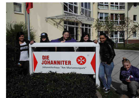
Odborné zahraniční stáže