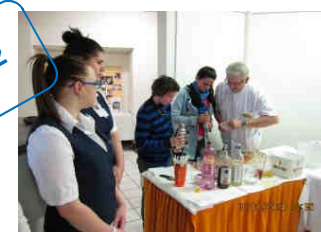
obor Číšník - servírka